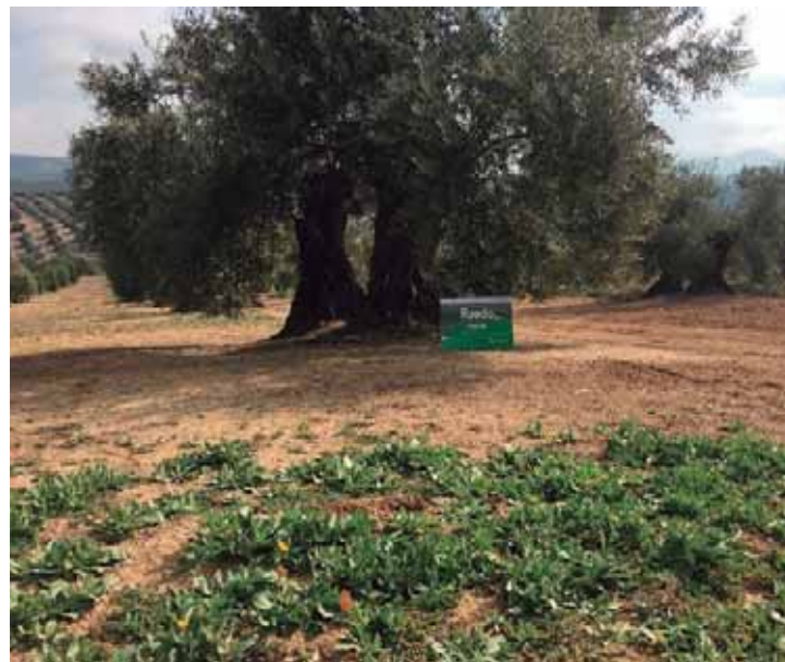
Eficácia Citadel® 4 meses após a aplicação.

Com o novo Citadel® assegure uma produção de qualidade, tanto da azeitona como do azeite, com o controlo mais eficaz de infestantes dicotiledóneas no olival. Para aplicar em pré-emergência e pós-emergência precoce.