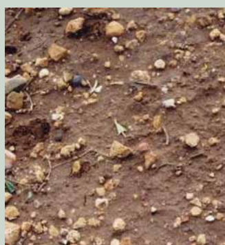
Infestantes em ponto verde

A máxima eficácia obtém-se com a aplicação no solo quando este se encontra com a humidade adequada ou caso se registem precipitações após a sua aplicação.