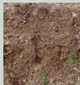
Infestantes em duas folhas