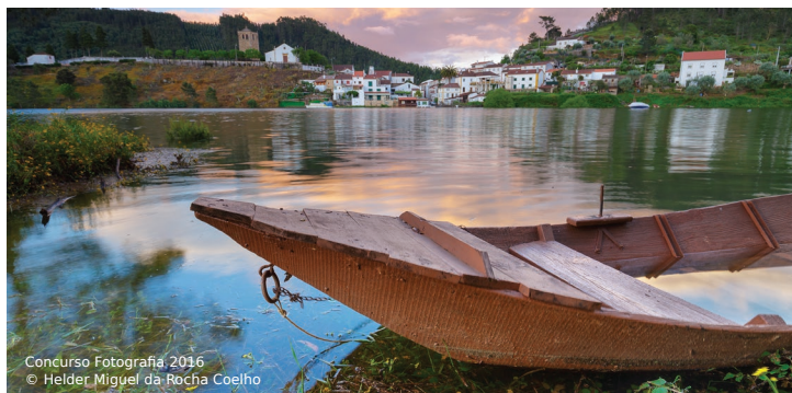
Concurso Fotografia 2016 © Helder Miguel da Rocha Coelho

Em Dornes ainda se constroem os tradicionais barcos do Zêzere “Três Tábuas” ou “Abrangel”, sendo o único local onde ainda persiste esta tradição do saber fazer que passou de geração em geração, até chegar às mãos de José Alberto, único artesão a trabalhar nesta arte. Meio de transporte para pessoas e mercadorias antigamente, hoje em dia é utilizado para pesca desportiva e lazer.